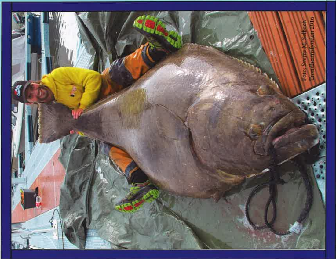
Trondheimsfjorden 2016